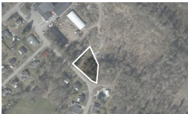
Figur 1: Planområdet.

En detaljplan kan förstås som ett juridiskt bindande dokument mellan kommun, stat, markägare, grannar och andra berörda. En detaljplan innehåller bestämmelser om hur marken får bebyggas och vad den ska användas till. Syftet är att göra avvägningar mellan allmänna och enskilda intressen för att nå en god helhetslösning. Planen ligger sedan som grund för beslut om t.ex. bygglov. En detaljplan gäller tills dess att den upphävs, ändras eller täcks av en ny.