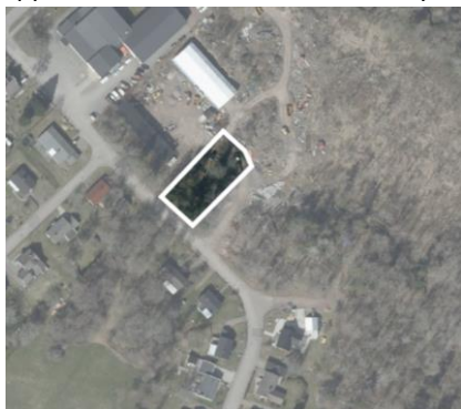
Figur 1: Planområdet.

En detaljplan kan förstås som ett juridiskt bindande dokument mellan kommun, stat, markägare, grannar och andra berörda. En detaljplan innehåller bestämmelser om hur marken får bebyggas och vad den ska användas till. Syftet är att göra avvägningar mellan allmänna och enskilda intressen för att nå en god helhetslösning. Planen ligger sedan som grund för beslut om t.ex. bygglov. En detaljplan gäller tills dess att den upphävs, ändras eller täcks av en ny.