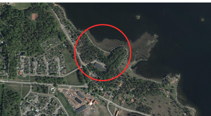
Planområdets lokalisering och avgränsning.

Planförslaget bedöms vara förenligt med Mönsterås Översiktsplans intentioner. En undersökning samt en miljökonsekvensbeskrivning har tagits fram i samband med planprocessen. Detaljplanen bedöms inte utgöra någon betydande miljöpåverkan. Den samlade bedömningen i den strategiska miljöbedömningen är att planförslaget inte anses orsaka någon betydande påverkan på miljö, hälsa eller hushållning av mark, vatten eller andra resurser.