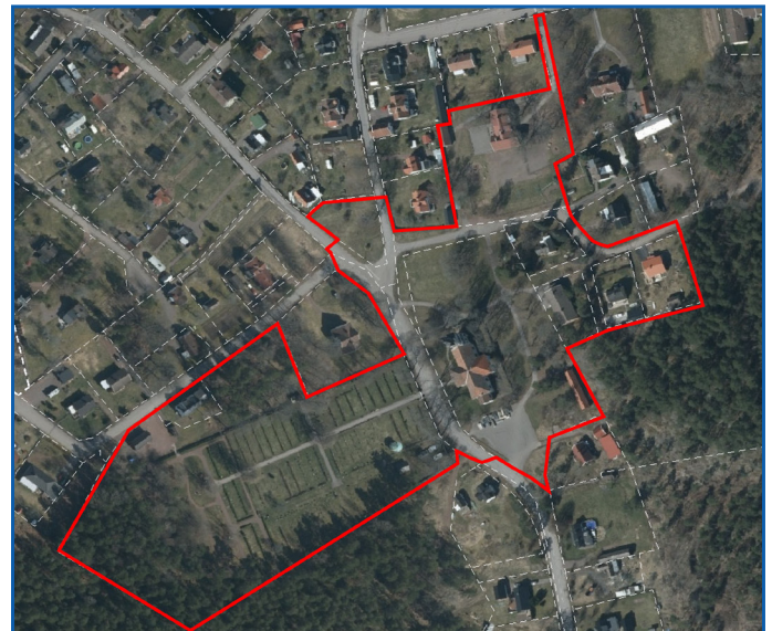
Planområdets lokalisering och avgränsning i Fliseryd.

Planområdet är beläget i de centrala delarna av Fliseryds samhälle, i anslutning till kyrkan. Planområdet omfattar ungefär 5,4 hektar mark. Detaljplanen omfattas av både allmän platsmark och kvartersmark.